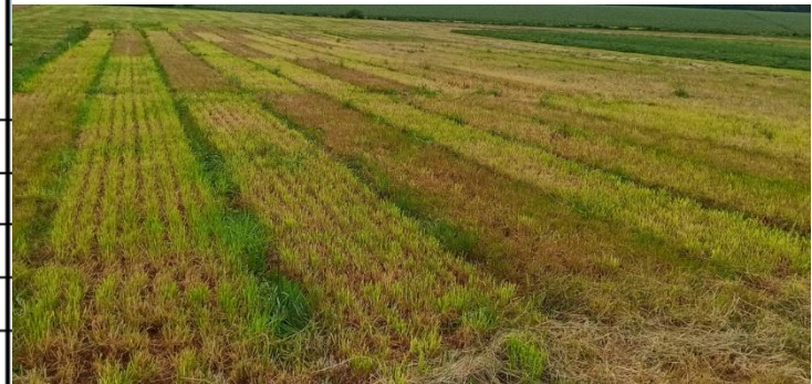
Fauche du 17/04 et photo du 24/04

Les jeunes repousses de fétuque ont rougi et les repousses de dactyle sont très claires (manque de minéralisation et de photosynthèse)