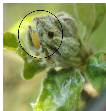
Chenille défoliatrice et son dégât