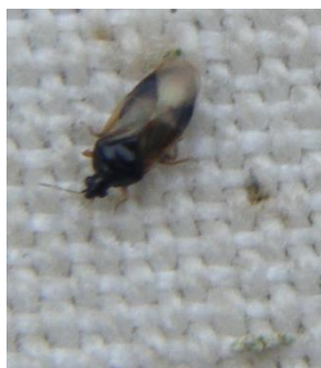
Punaise Orius : taille 2,5 mm

On observe de plus en plus de coccinelles adultes ( Adalia et Chilocorus ), de punaises prédatrices et d'adultes de syrphes et de chrysopes qui cherchent un lieu pour pondre au plus près des sources de nourriture.