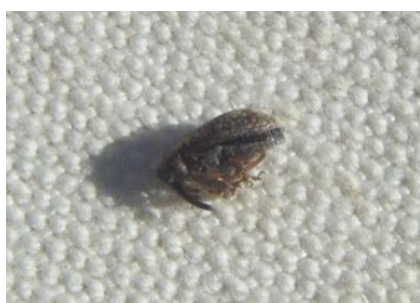
Anthome adulte immobile sur le tapis de battage