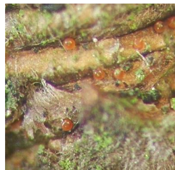
Œufs d'acariens rouges