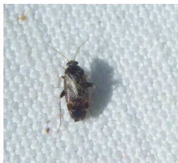
Punaise miride : taille 4 mm