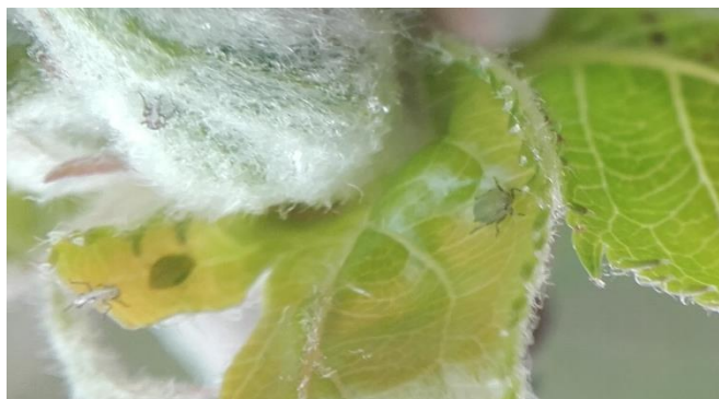
Pucerons verts non migrants

Les fondatrices s'étant développé, il est maintenant plus facile de différencier les pucerons verts des pucerons cendrés.