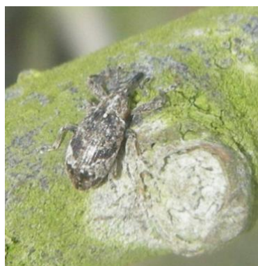
Anthome adulte (taille : 4 à 6mm)

Attention, en tombant sur le tapis de battage, l'anthome "fait le mort", il faut attendre quelques secondes avant qu'il se remette à bouger.