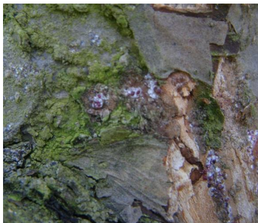
Cochenilles rouges du poirier