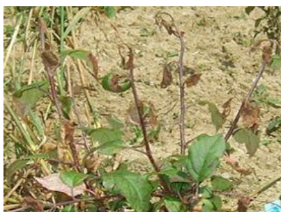
Feu bactérien sur jeune pommier

Les organes atteints (fleurs, pousses, ...) se nécrosent et noircissent. On observe une production d'exsudat : gouttelette blanc jaunâtre puis ambrée. Ce liquide qui contient la bactérie est collant.