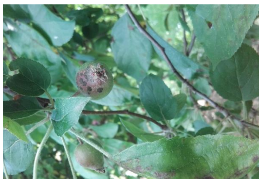
Taches de tavelure sur fruits

D'après le modèle RimPro, c'est la fin théorique des contaminations primaires pour toutes les régions, il n'y a plus d'ascospores projetables.