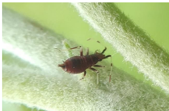
Larve de Deraeocoris

Les adultes sont de forme ovale (4 à 7mm) et de couleur soutenue (noir, ocre, gris, ...). Les larves sont de couleurs variables selon les espèces (violet, rougeâtre ou gris), elles peuvent consommer jusqu'à 200 pucerons durant leur développement.