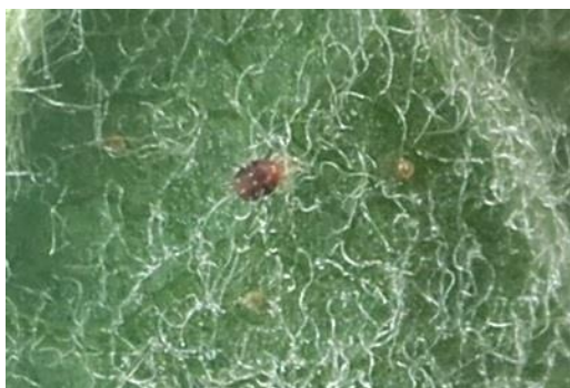
Acarien rouge et œufs d'été

De plus, les acariens prédateurs sont maintenant visibles dans les trois régions et vont mettre en action leur aptitude de régulation des populations d'acariens rouges.