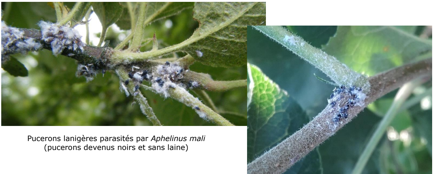
Pucerons lanigères parasités par Aphelinus mali (pucerons devenus noirs et sans laine)

En Normandie et en Bretagne, il n'y a pas encore de migration vers les pousses de l'année. Par contre en Pays de la Loire, les migrations vers les pousses sont observées.