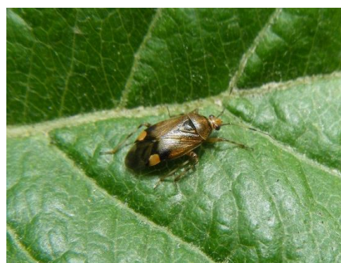
Adulte de Deraeocoris