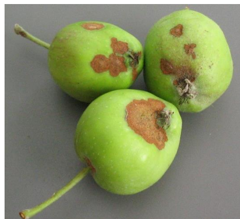
Taches de tavelure sur fruits

Les ascospores et les conidies requièrent le même nombre d'heures d'humectation pour contaminer la plante hôte (Stensvand et al., 1997).