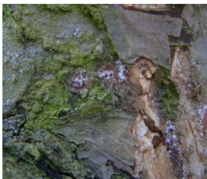
Cochenilles rouges du poirier