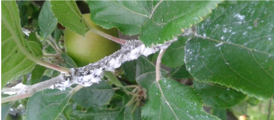
Foyer de pucerons lanigères

Dans les vergers à pression modérée, ils devraient pouvoir contenir les foyers des pucerons lanigères en expansion.