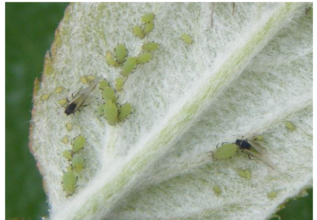
Pucerons verts non migrants

Attention tout de même aux jeunes vergers pour lesquels on utilisera un seuil de 25% d'organes occupés.