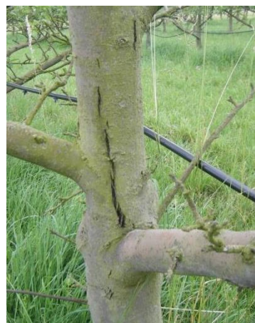
Dégât de cochenilles rouges du poirier