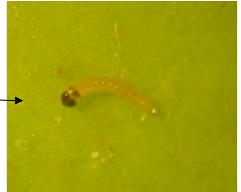
Jeune larve de carpocapse