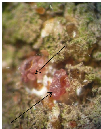
Femelle de cochenilles rouges du poirier avec œufs