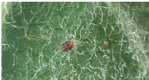
Acarien rouge et œufs d'été

La présence des acariens rouges est très hétérogène d'un verger à l'autre mais aussi d'une variété à l'autre.