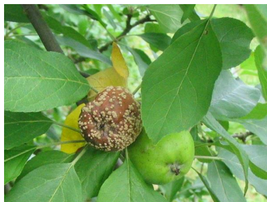
Moniliose sur fruit

La déclaration et le développement de ce champignon sont favorisés par les blessures : attaques de ravageurs (piqûres de carpocapses, morsures d'insecte, forficules), grêle et fortes pluies.