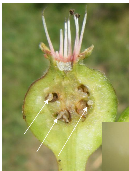
Larves de cécidomyies des poirettes dans le fruit