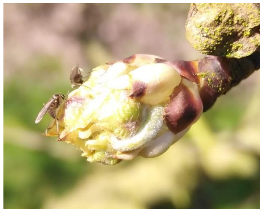
Cécidomyies des poirettes

Les cécidomyies des poirettes présentent une seule génération par an. Les larves se développent dans les très jeunes fruits. Ce n'est que fin avril –début mai, que nous pouvons observer des fruits plus sphériques et volumineux, en forme de «calebasse». Ces fruits noircissent ensuite avant de tomber au sol. A l'intérieur des fruits se trouvent plusieurs asticots.