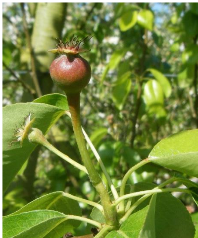
Fruit « calebassé »

En Bretagne, une cage d'émergence a été mise en place avec des asticots de l'année dernière. Les observations seront communiquées la semaine prochaine.