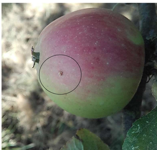
Dégâts de carpocapse

Aucune piqûre n'a été observée en Bretagne et en Normandie dans les vergers du réseau.