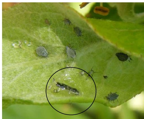
Larve de syrphé dans un foyer de pucerons cendrés