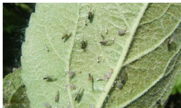
Pucerons cendrés aillés