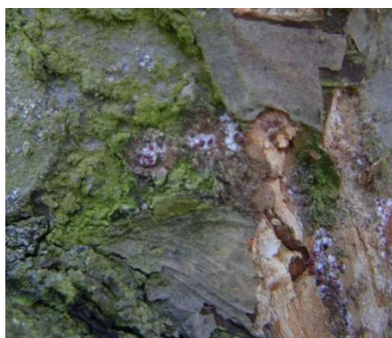
Cochenilles rouges du poirier