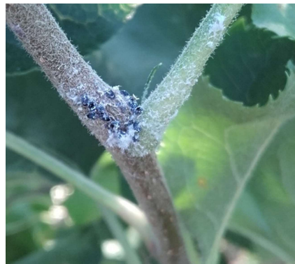
Pucerons lanigères parasités par Aphelinus mali avec trous d'émergence de l'auxiliaire.