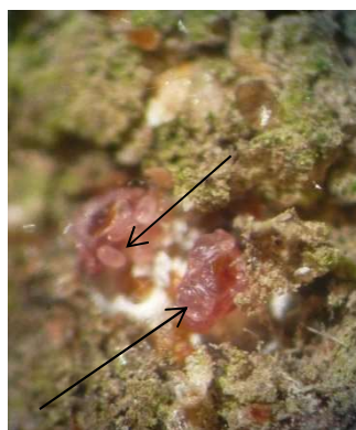
Femelle de cochenilles rouges du poirier avec œufs