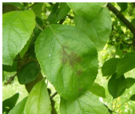
Taches de tavelure sur feuille et sur fruits