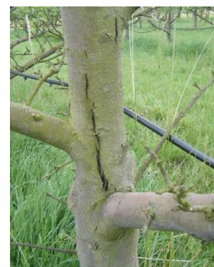
Dégât de cochenilles rouges du poirier