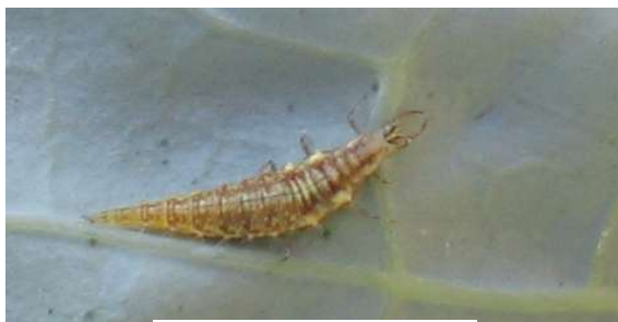
Larve de chrysope

L'adulte est un insecte fragile de couleur vert clair. Ses ailes sont longues et transparentes, fortement veinées. Il a les yeux de couleur or.