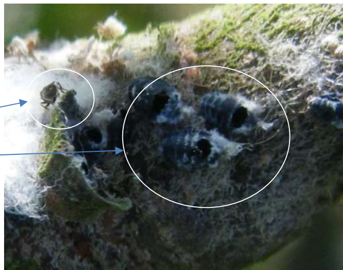
Aphelinus mali et pucerons lanigères parasités