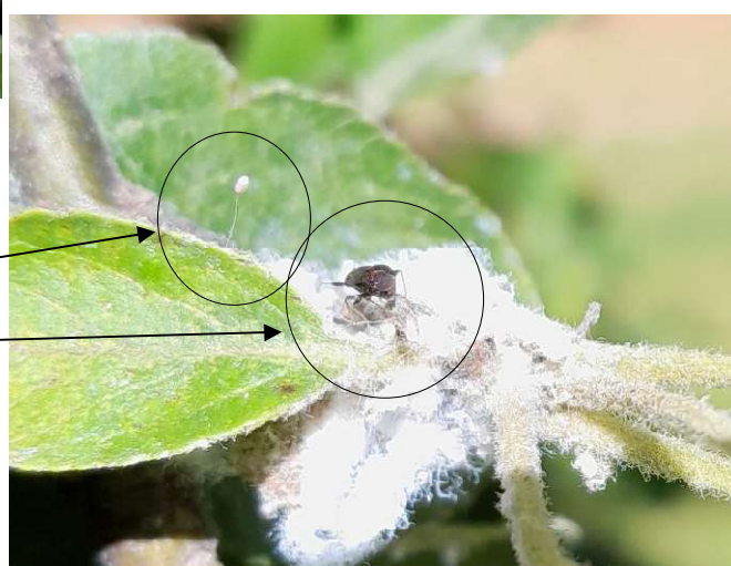
Œuf de chrysope et punaise Atractotomus dans un foyer de pucerons lanigères