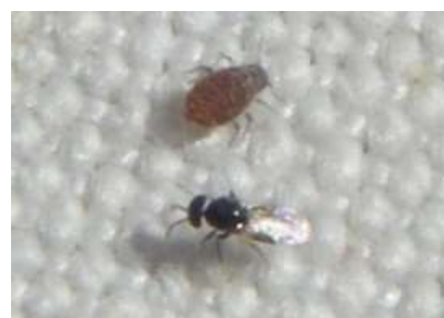
un puceron lanigère et un Aphelinus mali