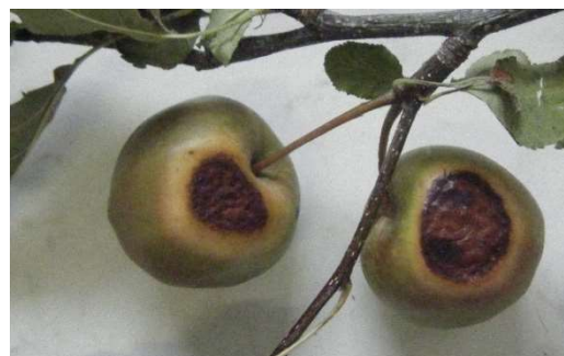
Dégâts de coup de soleil