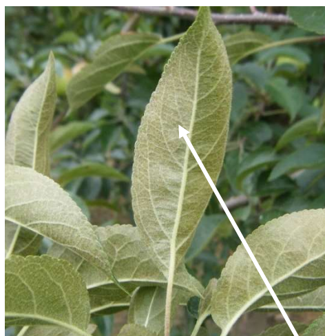
Brunissement de la feuille par les phytoptes libres

Lors de fortes attaques on peut noter un blocage du grossissement des fruits.