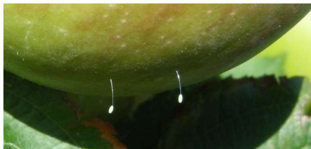
Œufs de chrysope

La larve mesure 8 mm, de forme allongée et de couleur brune. Elle est munie de puissantes mandibules en forme de pince et de 3 paires de pattes.