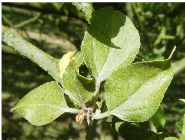
Dégâts d'acariens rouges

Les acariens prédateurs sont souvent peu nombreux. Les punaises prédatrices (notamment des genres Atractotomus sp et Heterotoma sp ) sont présentes en grand nombre et actives dans les vergers. (Cf BSV n°13 pour la description de ces auxiliaires). Des coccinelles Stethorus sp. sont également observées en Pays de la Loire.