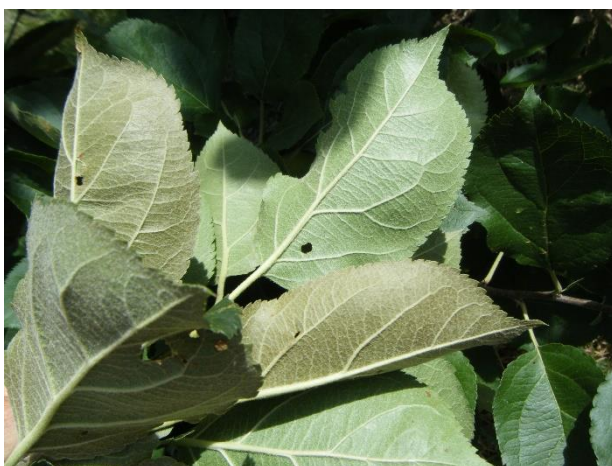
Brunissement de la face inférieure des feuilles causé par les phytoptes

Lors de fortes attaques, on peut noter un blocage du grossissement des fruits.