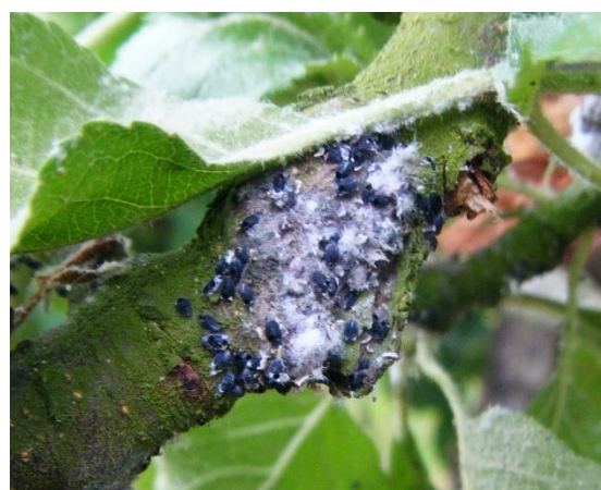
Pucerons parasités par Aphelinus mali

L'activité de parasitisme d' Aphelinus mali s'intensifie et s'installe. Il faut le préserver et lui laisser le temps de faire son travail de parasitisme. Surveillez l'installation de la faune auxiliaire. Evolution à suivre.