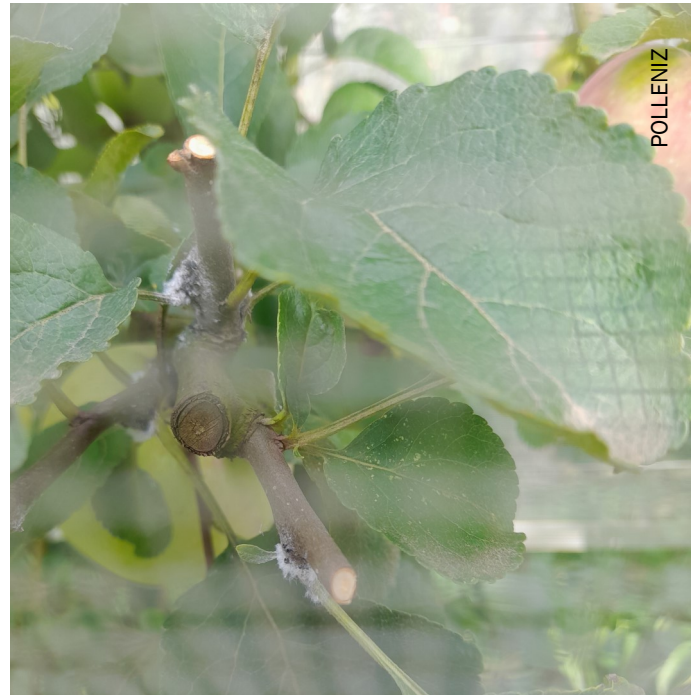
Reprise d'activité des pucerons lanigères (à droite sous filet mono rang)