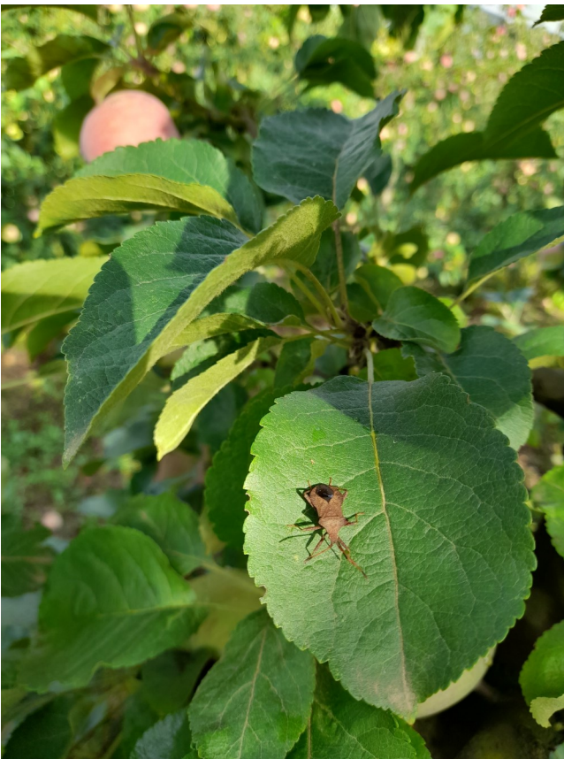
Rare adulte de Coreus marginatus observée