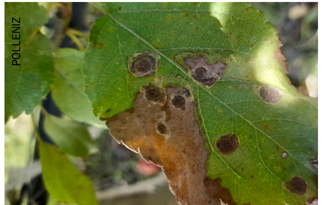
Mines sur feuilles de pommier

Les parcelles inscrites pour les exports vers les Etats Unis doivent être indemnes de mineuses cerclées.