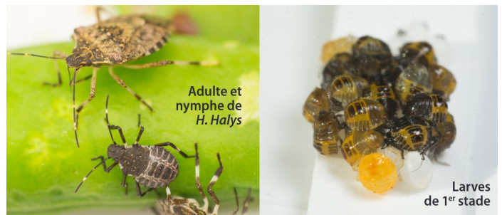
Photos fiche punaise diabolique Sud arbo 2021

Des larves et adultes ont été capturés sur plusieurs sites en région Centre. Des larves de différents stades ont été signalées la semaine dernière, en Indre-et-Loire.