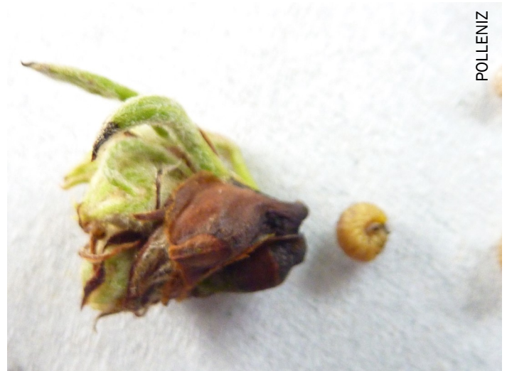
Larve d'anthonome du poirier

Ces observations sont à réaliser le matin, lorsqu'ils sont actifs (s'alimentent et pondent).