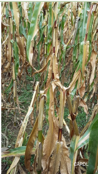
Tiges cassées à mi hauteur (dû à la présence de larves de pyrale)