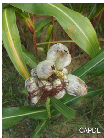
Charbon à Ustilago