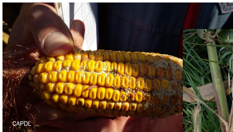
Dégâts et larves sur épis

Si elle est vide, c'est le signe de la présence d'une 2ème génération (2ème vol) en août.