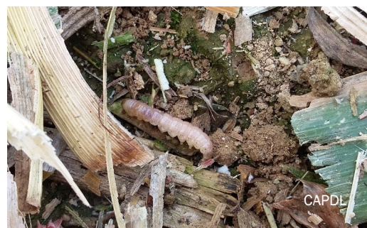
Larve de sésamie