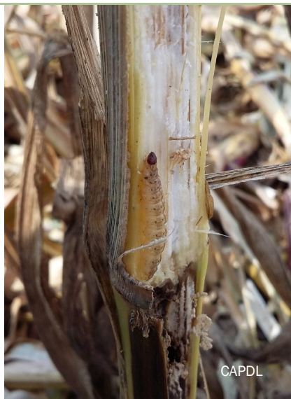
Larve de pyrale