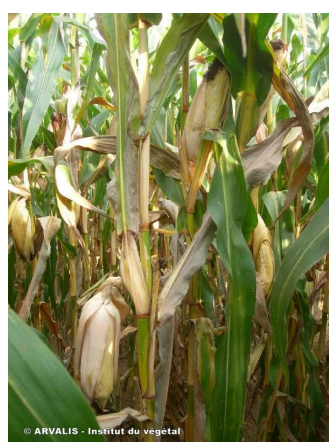
Coup de feu fusarien