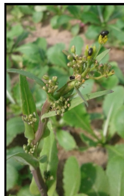
Altises dans parcelle de navet. Crédit photo : CDDL

Les populations d' altises se maintiennent dans les parcelles de brassicacées suivies sur le 49.