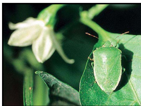
Punaise Nezara.

Dans le 44, la punaise Nezara viridula s'installe dans les parcelles de concombre hors sol avec 1% des plantes présentant au moins un individu à Carquefou et 30% à St-Philbert-de-Grand-Lieu. Le retour d'un temps plus frais devrait permettre de limiter sa propagation dans les cultures.