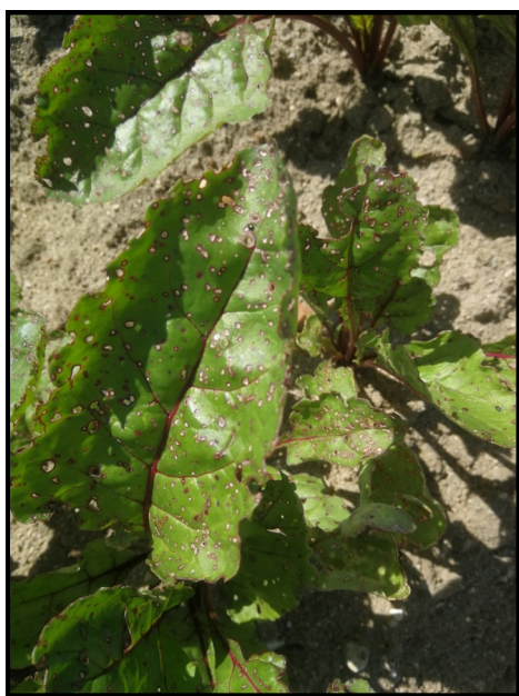
Cercosporiose sur betterave.

Dans le nord des Deux-Sèvres (79), la cercosporiose se propage en parcelle de betterave.