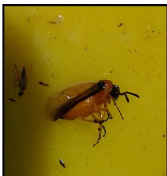
Tenthredine de la rave.

Le vol de piérides et de tenthredes est également à surveiller en parcelles de chou.