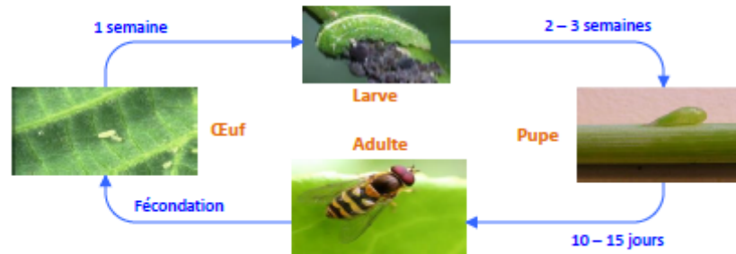
Cycle biologique des Syrphes

Le nombre de générations par an dépend des espèces de syrphes, et des conditions du milieu : entre 1 et 7 générations/an entre avril et octobre.