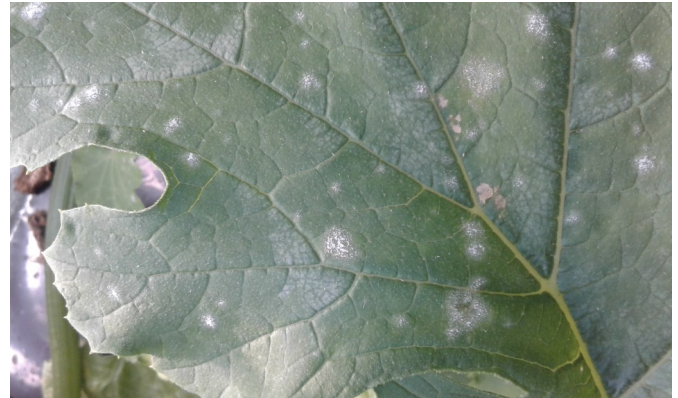
Oïdium sur courgette - Crédit photo : CDDL

En parcelle de courgettes à Cholet (49), des symptômes d' oïdium sont observés en semaine 14. La pression est faible.