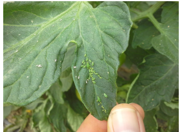
Pucerons sur tomate