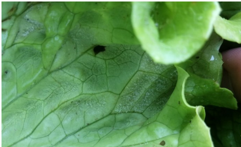
Mildiou sur salade