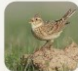
Alouettes des champs, Mel Smith

Espèces des milieux ouverts, plaines, steppes, marais et prairies. Souvent associées et très sensibles aux pratiques agricoles.