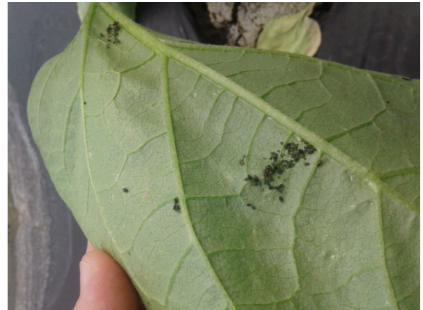
Pucerons sur aubergine - Crédit photo : CDDL