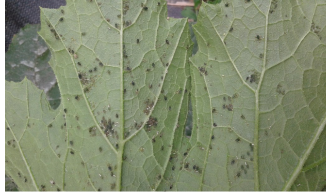
Pucerons sur courgette