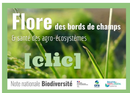
Haie fleurie en bord de parcelles