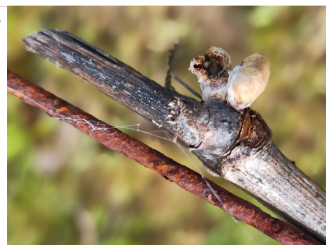
Dégâts de mange-bourgeons — photo : M. Jehanno CDRPDL

Les températures prévues pour les prochains jours sont fraîches et la pousse de la vigne n'accélèrera vraiment qu'à partir du début de la semaine prochaine. Vigilance sur les parcelles à historique.