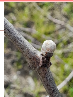
Bourgeon de côté stade « bourgeon dans le coton »

En cette fin de mois de mars, la moitié des parcelles a atteint le stade « bourgeons dans le coton » (BBCH 05-06). Les parcelles les moins avancées ont encore une majorité de bourgeons en dormance, tandis que les plus avancées atteignent le stade sortie des feuilles (BBCH 10).