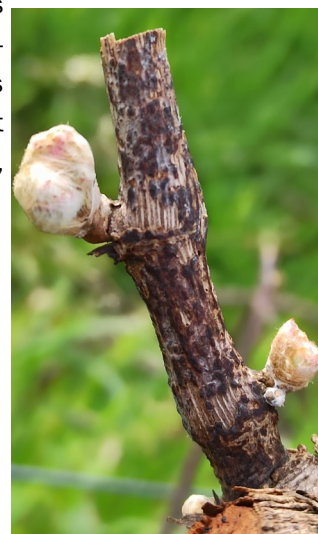
Excorticose sur bois d'un an — photo : M. Jehanno CDRPDL

Les prochains jours annoncent de la pluie et des températures favorables à un développement lent de l'excorticose. Les vignes les plus avancées ayant déjà atteint le débourrement et présentant des symptômes sur les bois de l'année dernière pourraient dès lors subir des contaminations. Vigilance sur les parcelles et les cépages sensibles (Cabernet Sauvignon, Grolleau, Chenin, Folle Blanche, Floréal ...).