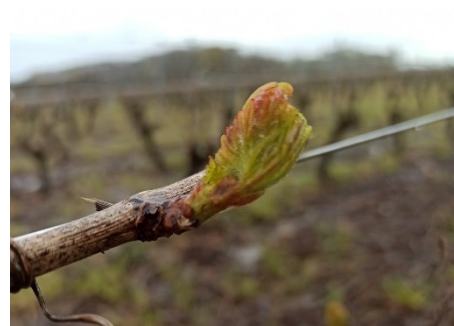
Bourgeon de chardonnay au stade « pointe verte »

Avec les premiers jours d'avril le stade « pointe verte » (BBCH 09) devient majoritaire sur la région. Les parcelles les plus tardives ont atteint le stade « bourgeons dans le coton » (BBCH 05-06) alors que les plus précoces ont déjà étalé leurs 1ères feuilles (BBCH 11).