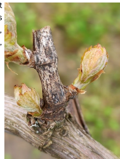
Excariose sur bois d'un an

Les prochains jours annoncent de la pluie et des températures favorables à un développement lent de l'excariose. Les vignes les plus avancées ayant déjà atteint le débourrement et présentant des symptômes sur les bois de l'année dernière pourraient dès lors subir des contaminations. Vigilance sur les parcelles et les cépages sensibles (Cabernet Sauvignon, Grolleau, Chenin, Folle Blanche, Floréal ...).