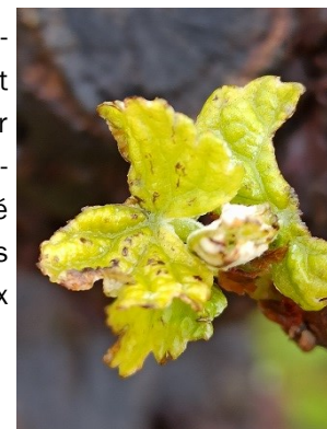
Dégâts d'escargots sur les 1ères feuilles étalées

trie de la saison. Surveillez particulièrement les jeunes vignes et les complants, très appétant pour les escargots. Les vignes approchent du stade de sensibilité maximale et les précipitations des jours à venir sont favorables aux escargots.