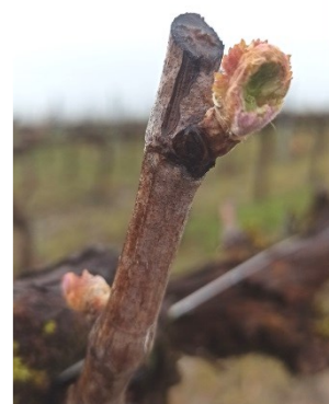
Dégâts de mange-bourgeons sur merlot

La pousse de la vigne devrait s'accélérer dans les jours à venir compte tenu de la phénologie et des températures annoncées. Une fois les 1ères feuilles étalées, les mange-bourgeons n'occasionneront plus de dégâts. Vigilance sur les parcelles à historique.