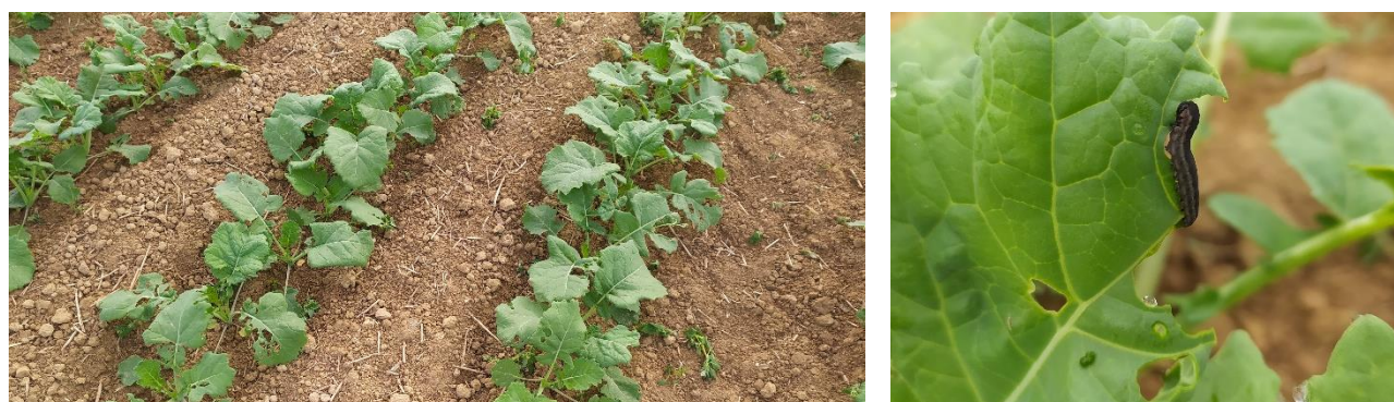
Figure 1. A gauche : Colza semé le 21 août à RUILLE-LE-GRAVELAIS (stade 6 feuilles). A droite : photo d'une larve de tenthrède de la rave.

Des larves de tenthrède ont été observées sur quelques parcelles de notre réseau. Elles consomment rapidement le limbe des feuilles, ne laissant que les nervures. Le colza y est sensible jusqu'au stade 6 feuilles.