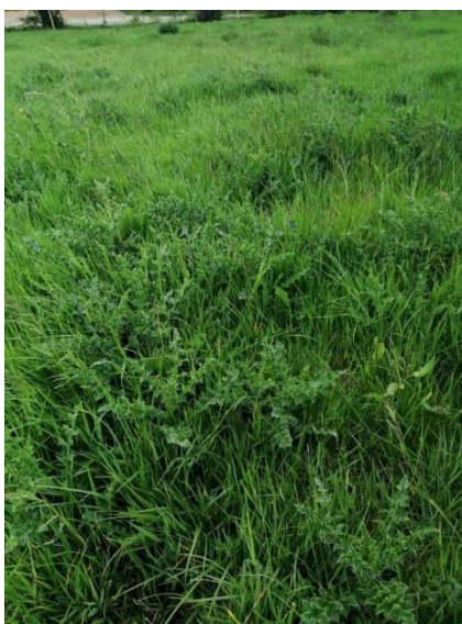
Chardon des champs au stade végétatif

C'est le bon moment pour faucher les chardons communs qui sont en fleur. Ce sont des plantes bisannuelles de grande taille. S'ils sont coupés avant la formation des graines, ils ne repartiront pas car ils se seront épuisés à produire leur hampe florale, le tour est joué.