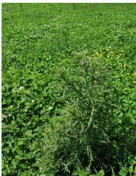
Chardon commun en bouton