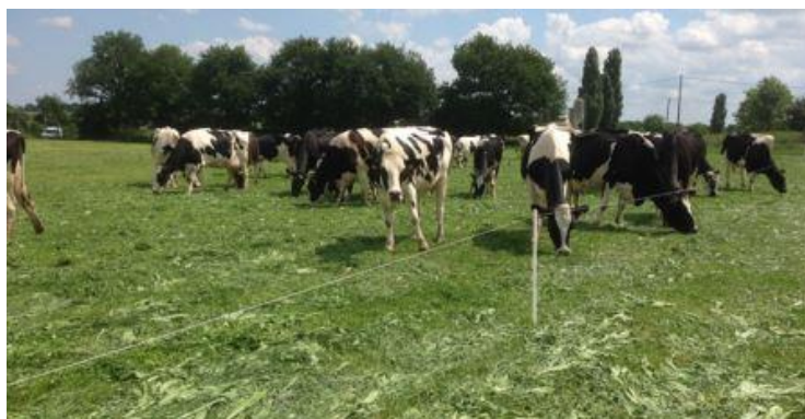
Un topping bien pâturé !

En cette période un tour des parcelles s'impose. Certaines parcelles vont repartir plus vite que d'autres, selon la flore en présence et si les prairies ont souffert de la période séchante ou non. La règle d'or, pour prolonger au maximum le pâturage, est de faire consommer prioritairement les parcelles dont le stade est le plus avancé (graminées qui se lignifient et deviennent plus encombrantes) et de ralentir la vitesse de rotation en lien avec la quantité d'herbe disponible. Le topping est un bon moyen de faire consommer une végétation