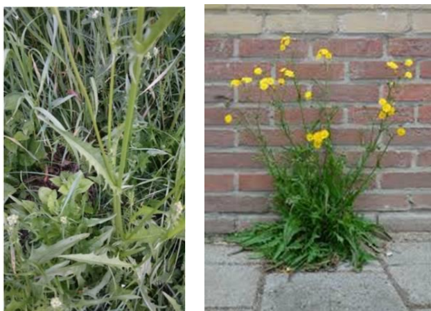
Les crépides et picrides sont en montaison

en fin de semaine car pour le foin, il faudra attendre la semaine suivante. Regarder aussi la présence de plantes indésirables telles que les crépides (photos) et les picrides qui sont en montaison et peuvent encore être consommées, ce ne sera plus le cas quand la chaleur reviendra.