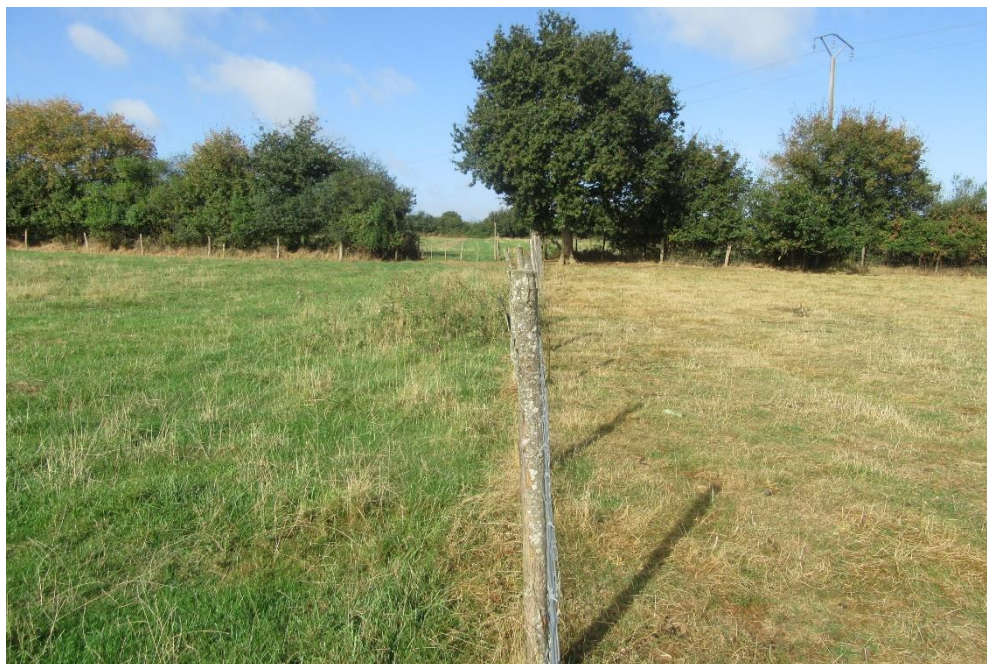
A gauche : paddock non pâturé en été ; à droite : paddock pâturé en été. Photo prise en septembre 2016.