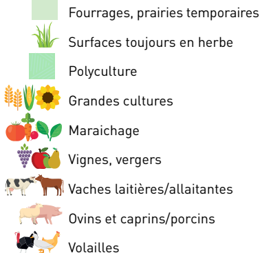
Illustration inspirée des tendances de culture et d'élevage.