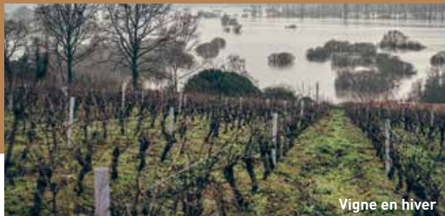
Vigne en hiver

Sitôt après les vendanges, le travail reprend dans la vigne : arrachage des souches mortes , préparation des futures plantations et du sol, semis des couverts végétaux, prétaille... À la cave, la vinification se poursuit , c'est le temps des premiers assemblages et de la mise en bouteille des primeurs.