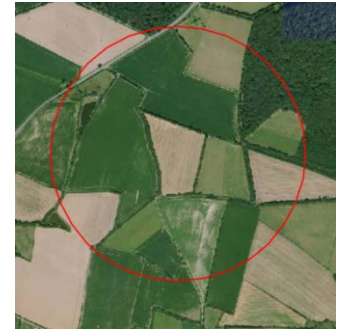
3 parcelles en milieu fermé par département