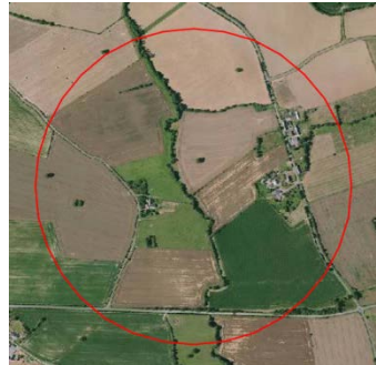
3 parcelles en milieu ouvert par département