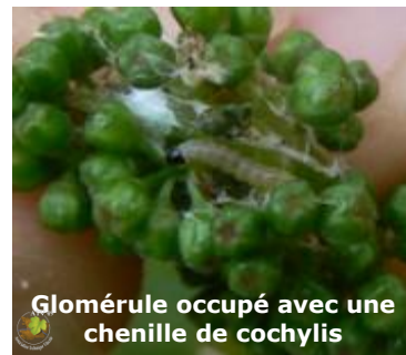
Glomérule occupé avec une chenille de cochylis