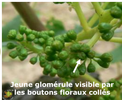
Jeune glomérule visible par les boutons floraux collés