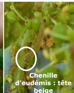
Chenille d'eudémis : tête beige

Faire un comptage sur 25 souches (5 x 5 souches) et regarder 4 inflorescences par souches. Les comptages débutent dès que les boutons floraux commencent à se séparer . Ils doivent être réalisés deux fois par semaine , afin de positionner l'insecticide aussitôt que le seuil de traitement est dépassé.